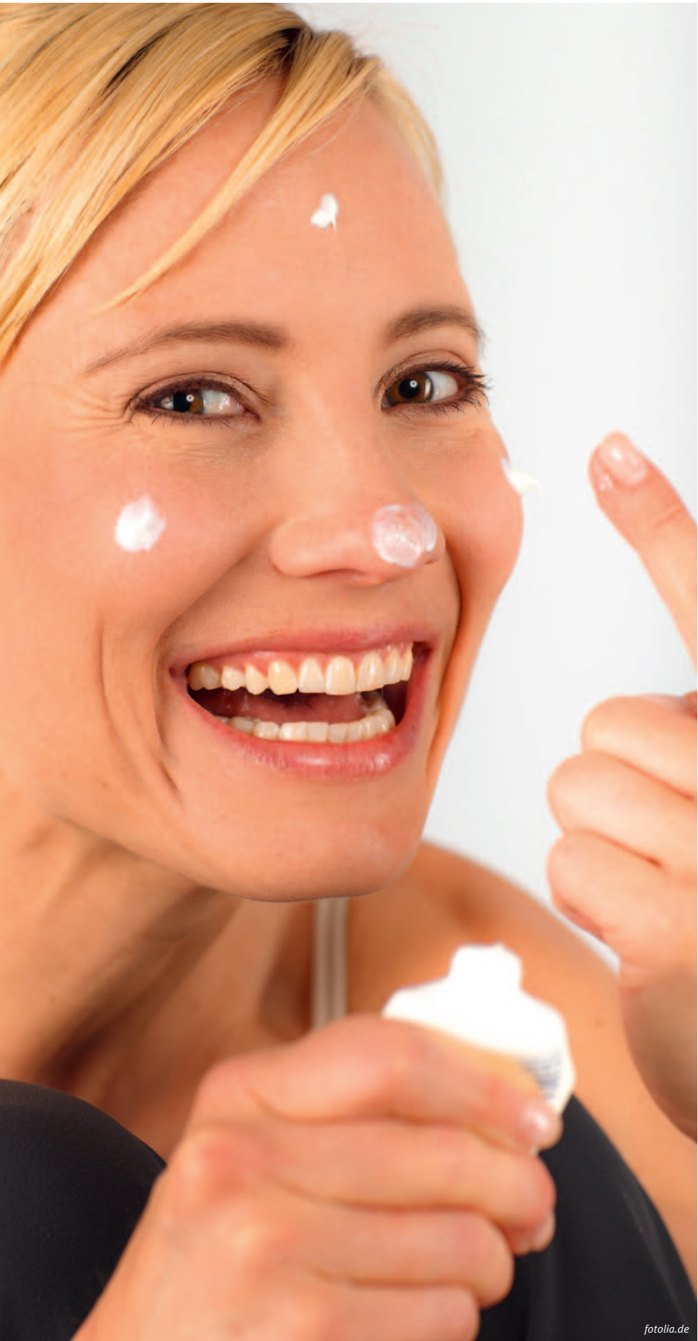
D’après son fabricant, l’OM24 convient parfaitement à la médication personnalisée.

Au niveau cellulaire et subcellulaire, OM24 inhibe les effets des radicaux libres. De deux manières: en neutralisant directement les fameux radicaux libres et en stimulant les mécanismes endogènes de défense contre les radicaux libres. Des expériences sur des mitochondries l’ont clairement démontré. La fonction de protection cellulaire a également été prouvée sur les cellules cutanées humaines: des expositions répétées à des rayonnements UV intensifs (80J/m 2 ), avec et sans traitement préalable avec OM24, ont montré qu’OM24 peut réduire la mortalité cellulaire liée aux UV. La protection peut même durer 24 heures. Par ailleurs, OM24 diminue les lésions de l’ADN provoquées par les rayons UV. La protection, au premier et second niveau, se base donc sur le fait que la substance stimule les mécanismes cellulaires de protection et de réparation tout en stabilisant les fonctions des organites.