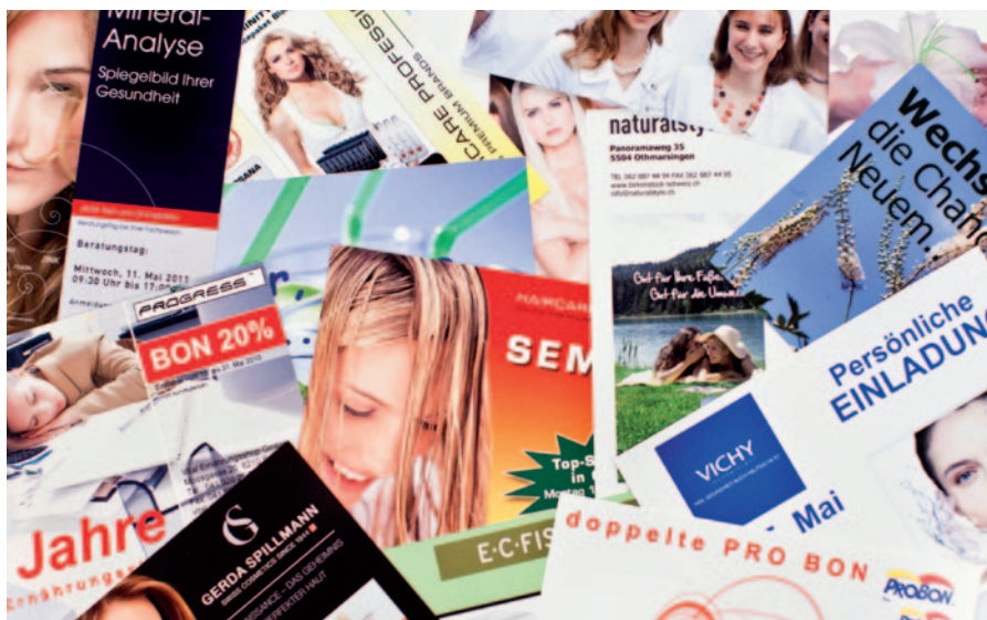
Kleiner Aufwand – grosse Wirkung: Postkartenmailing via DirectFactory.

Mit dem Mailing-Kreationstool DirectFactory ist es ganz einfach, bei Kunden im Gespräch zu bleiben oder zukünftige auf sich aufmerksam zu machen. Dank der Zusammenarbeit zwischen dem Drogistenverband und der Post erhalten Mitglieder auch im Jahr 2012 einen Spezialrabatt.