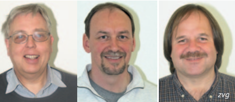
Le comité d'Employés Droguistes Suisse invite tous les droguistes à son assemblée générale.