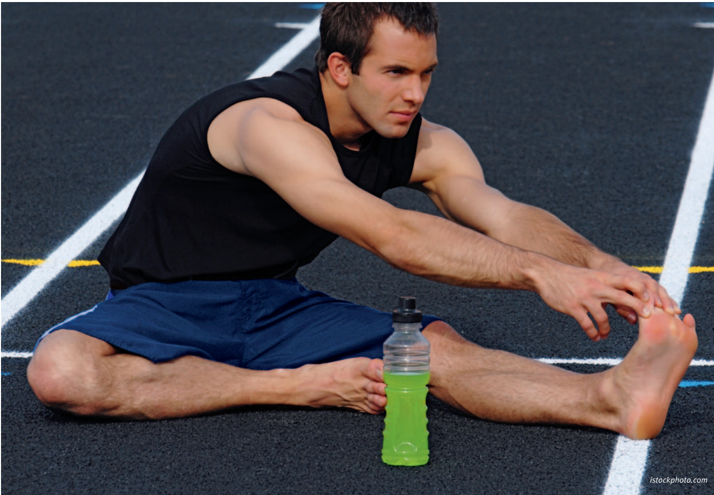
Pendant l'entraînement et la compétition, les sportifs de pointe devraient faire le plein d'énergie chaque heure ou au moins toutes les deux heures.

Préparez-vous à répondre à vos clients: la Tribune du droguiste d'avril se penche aussi sur les aliments pour sportifs .