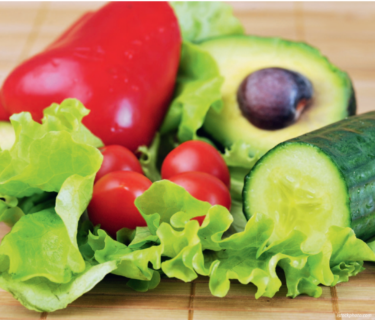
Salade, concombre, tomates et avocat figurent au menu d'une alimentation riche en aliments basiques.

le transport du calcium (via la Calcium Binding Protein CaBP). Comme il s'agit d'une hormone stéroïdienne, elle peut pénétrer dans le noyau des cellules et se fixer à l'ADN (facteur de transcription). ➤ Elle active en outre la mobilisation du calcium dans l'organisme et dans les os pour relever son taux dans le sérum.