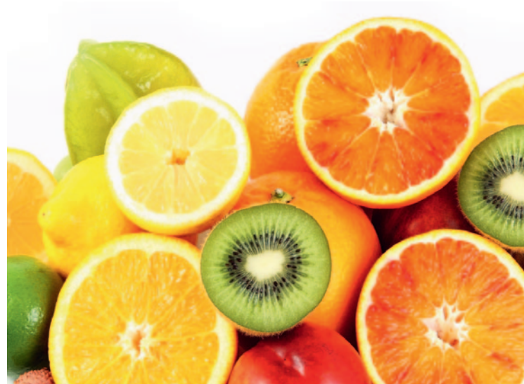
Kiwis, pommes et citrons préviennent l'hyperacidité de l'organisme.

manière passive via un gradient électrochimique dans l'intestin. Le calcium doit être sous forme soluble ou lié à une protéine soluble. L'absorption dans ce cas est proportionnelle à la quantité de calcium disponible: plus la concentration est élevée, plus l'absorption est importante. Le calcium présent dans le lait se lie aux phosphopeptides de la caséine et aux acides aminés de la L-lysine et de la L-arginine. Ils forment des chélates solubles avec le calcium. Sous cette forme, le calcium peut bien être résorbé par l'épithélium de l'intestin. L'alternative consiste à transporter et absorber activement le calcium.